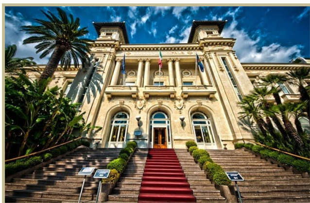
Fig. nr. 1 Cazinoul din Sanremo

Orașul Sanremo face parte din provincia Imperia, cu cei aproximativ 57.000 de locuitori ai săi clasându-se pe locul 4 la nivelul regiunii. Este una dintre stațiunile turistice cele mai căutate din Italia, renumită și pentru cultivarea florilor, fapt ce i-a atras denumirea de „Oraș al Florilor”. Orașul se poziționează la poalele a doi versanți ai Muntelui Bignone, care practic se termină în valurile Mării Mediterane. Numele de Sanremo, în trecut scris și în două cuvinte San Remo, derivă din numele lui San Romolo, sfântul protector al orașului.