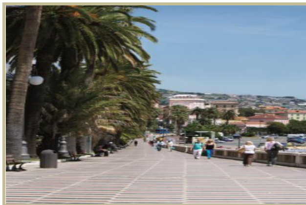
Fig. nr. 2 Corso Imperatrice

Corso del Imperatrice este un bulevard lung, de promenadă, construit între 1869-1871. Acesta reprezintă fața elegantă, cosmopolită a orașului și te poartă în timp, prin frumusețea sa aparte, unde se plimbau nobilii ruși și chiar împărăteasa Sissi.