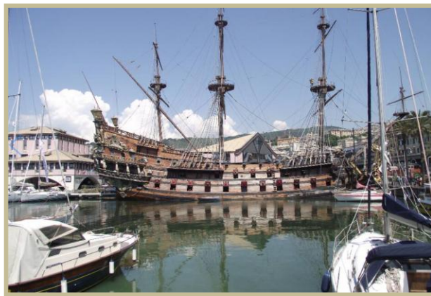
Fig. nr. 4 Portul Vechi

Portul vechi și Aquarium din Geneva reprezintă o altă destinație de neratat. Aici există un far vechi de o mie de ani, un acvariu uriaș al orașului, Muzeul Maritim și o grădină botanică. După realizarea filmului lui Roman Polanski „Pirații”, în port a rămas o fregată cu trei catarge, care a atras atenția atât a copiilor, cât și a adulților. De asemenea, este interesant Muzeul Maritim al Mării Mediterane, ale cărui exponate povestesc despre întreaga istorie a navigației, de la bărci cu vâsle la nave moderne. Cel mai mare acvariu din Italia se află în Genova. Se numește Acquario di Genova și ocupă o suprafață de 3100 m 2 , în timp ce în interiorul clădirii aproape 10 mii m 2 sunt disponibili pentru vizitare. Acvariul din Genova este inima universului Acquario Village administrat de Costa Edutainment din Genova, ce conține Muzeul Mării Galata, cel mai mare muzeu marin din zona Mediteranei, cu submarinul S518 Nazario Sauro, Muzeul Național al Antarcticii, biosfera și liftul panoramic Bigo. 3