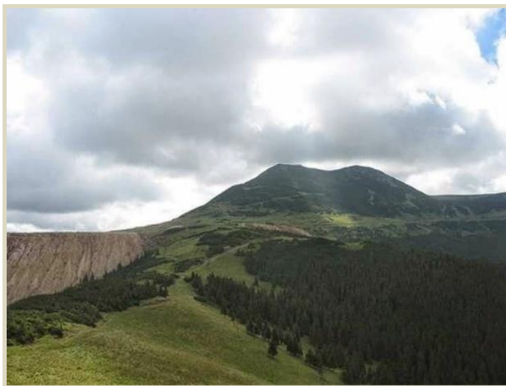
Fig.1 Munții Călimani

Bilborul este punctul de plecare către alte destinații turistice deosebite, precum Toplița, Ditrău, Lăzarea, Gheorghieni și Parcul Național Călimani, toate oferind experiențe unice în cadrul naturii autentice românești. Descoperiți Bilborul - un loc special, unde biodiversitatea, aerul curat și apele minerale se întâlnesc pentru a crea o experiență de neuitat în mijlocul naturii.