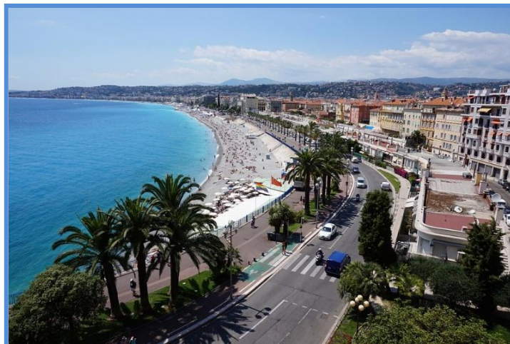
Fig.3 Coasta de Azur

Calitatea produselor și serviciilor în contextul ostentației devine o preocupare esențială. Este vital să ne întrebăm dacă companiile investesc în inovație și îmbunătățirea serviciilor sau dacă se bazează doar pe imaginea de lux pentru a atrage clienții. Astfel, se pune sub semnul întrebării dacă creșterea cererii pentru produse și servicii extravagante contribuie sau nu la îmbunătățirea generală a ofertei.