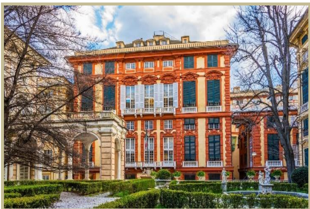
Fig. nr. 3 Palazzo Rosso

Cel mai faimos palat din piață este Palazzo San Giorgio, construit în secolul al XIII-lea pentru unchiul primului doge din Genova. Când căpitanul a fost trimis în exil, casa a devenit închisoare, cel mai faimos prizonier care a trecut pe aici fiind Marco Polo.