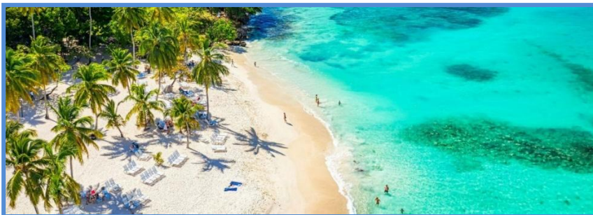
Fig.2 Republica Dominicană

Statisticile privind cheltuielile în turism arată că, în unele cazuri, acestea pot fi disproportionale în raport cu beneficiile reale aduse comunităților locale sau mediului. Astfel, o analiză economico-financiară atentă ar putea evidenția neajunsurile acestui model și ar putea sugera alternative mai sustenabile.